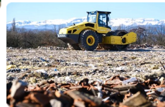
Flyer "Version September 2024"

1,000 m from six villages and 500 m from the Manor Shopping Centre